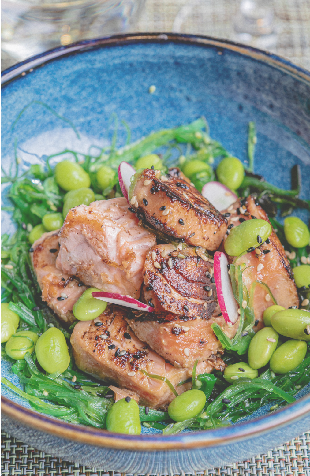
Salmón marinado en miso blanco. Izokin-dado marinatuak miso zurian Salmon marinated in white miso. Saumon marinés à l'Asiatique miso blanc