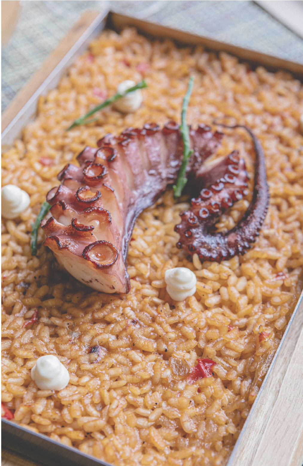
Arroz meloso de pulpo y salicornia Olagarro eta salikornia arroz melosoa Rice with octopus and salicornia Moelleux au poulpe et Asperge de Mer (Salicorne).