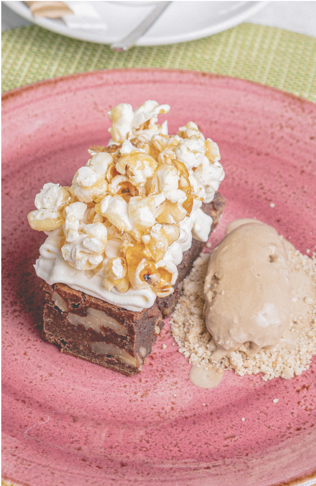
Brownie casero Etxeko brownie-a Homade Brownie Brownie de chocolat fait maison